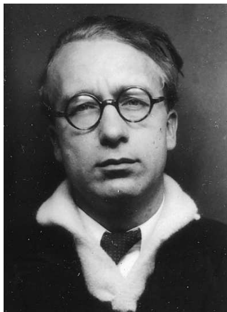
Aksel Sandemose, 1931.

Aksel Sandemose skrev ikke arbeiderdiktning i tradisjonell forstand, selv om det ofte handlet om arbeidsfolk i hans dikterverk. Skildringene rommet en dyptloddende individualpsykologi, der de psykologiske årsaker til undertrykkelse og jantelov kom for dagen. Likhetsidealet og dets vrangsider ble avdekket i skarpt lys. Kollektiv og individer ble sett med intimt kjennskap til den verden som ble skildret, ikke minst sjømannsskildringene. Hovedpersonen Espen Arnakke i En flyktning krysser sitt spor tilhører arbeiderklassen, men boken handler om en person på flukt fra Jante-miljøet og vekk fra underklassen. Den kom ut på det nystartede arbeiderpartiforlaget Tiden i 1933.