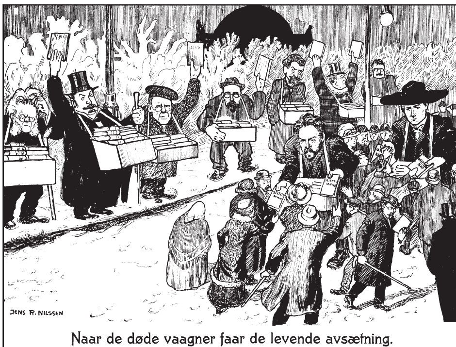
Naar de døde vaagner faar de levende avsæfning.

verk, romanserien om An-Magritt, handler om nattens brød, brød bakt i mørke tider, «Barkebrødstider». Gleden er der alltid, innerst inne bak det hele, som selve livsviljen, eller livsukueligheten. Men det er tyngsel over folket ved graven, Falkberget skildrer pengemakt og voldsmakt. Likevel, gjennom alle tider spirer livsviljen som fører til kamp for et bedre liv. Alt i sin debutbok Svarte Fjelde (1907) representerte dikteren Falkberget den sosiale realismes tradisjon i den form at han avslører utbyttingen i det kapitalistiske samfunnet. Han beskriver framfor alt gruvefolket og årsakene til misnøyen og kampen for et bedre og mer rettferdig samfunn.