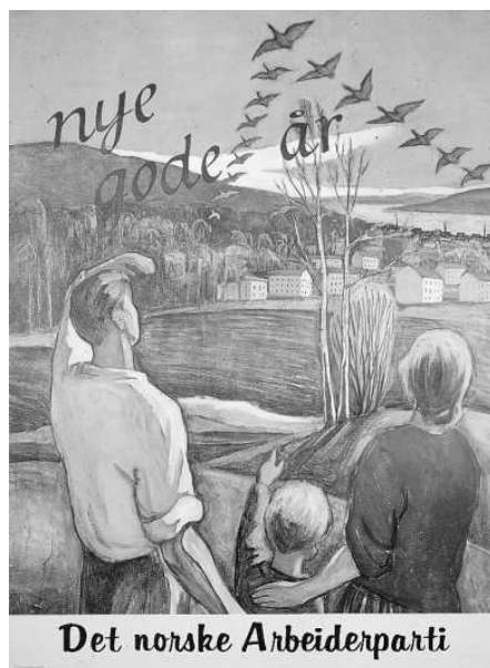
Arbeiderpartiets plakater til stortingsvalget 1961.