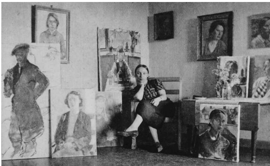
31 år og allerede et etablert navn som illustratør.