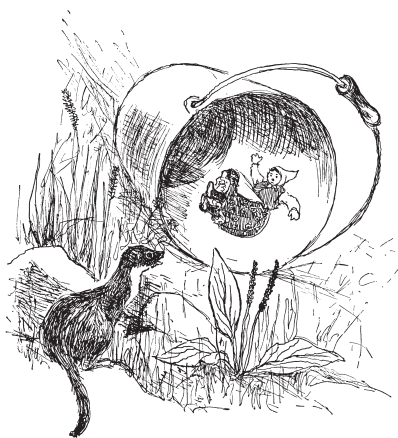
Illustrasjon fra Alf Prøysens Teskjekjerringa på camping, fra 1967.

i 1938, hadde kanskje mange av sangerne og historiene hans aldri sett dagens lys. Heldigvis, får man vel si, debuterte han samme år med diktet «Røde Geranier» i Kooperatøren , og resten er så og si historie.