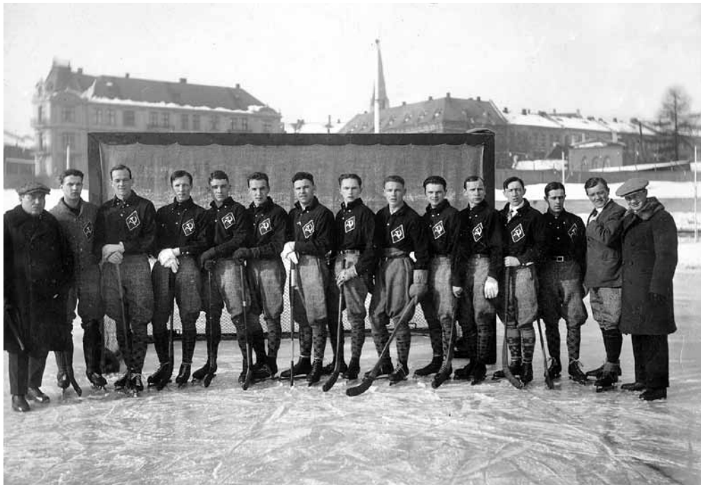
Det russiske bandylaget, fotografert på Dælenenga idrettsplass under Spartakiaden i Oslo, februar 1928.

med AIFs ledelse i spissen ønsket å nedtone det propagandamessige ved Vinterspartakiaden og heller fremheve idretten. Dette skapte misnøye hos RSIs delegasjon. Sportslig gikk arrangementet stort sett knirkefritt. Blant annet ble skøytetidene på Bislett bedre enn under et borgerlig stevne som ble holdt samtidig på Frogner Stadion. Sportshallen på Kampen var smekkefull under boksekampene. 66 Offisielt omtalte RSIs delegasjon Vinterspartakiaden som en suksess. 67 Uoffisielt var det derimot mye delegasjonen var misfornøyd med. Dette gjaldt alt fra forbedelsene til stevnet, det propagandamessige under stevnet, til premiene som ble sett på som borgerlige. I tillegg ble det også gitt uttrykk for misnøye med AIF-ledelsens opptreden under stevnet. 68