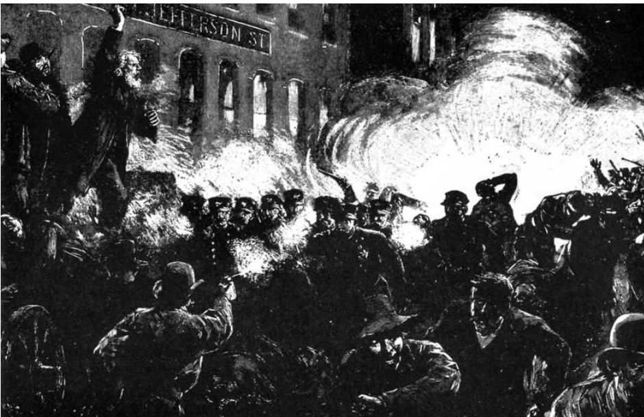
Bombeeksplosjonen på Haymarket 4. mai 1886 drepte fem og såret to politibetjenter. Etter en parodi av en rettsak ble sju anarkister dømt - fem til døden og to til livsvarig fengsel.