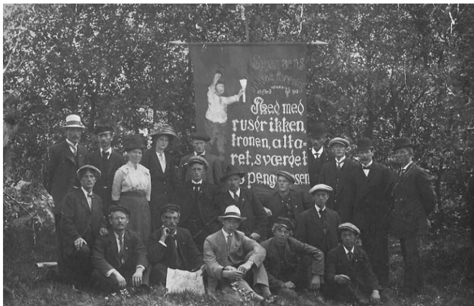
Spjærøen ungsosialistiske forening på Hvaler med sin fane i 1910. Det ungsosialistiske forbundet sto spesielt sterkt i steinhoggermiljøet rundt Iddefjorden, som hadde gode kontakter til den svenske syndikalistorganisasjonen Sveriges Arbetares Centralorganisation.