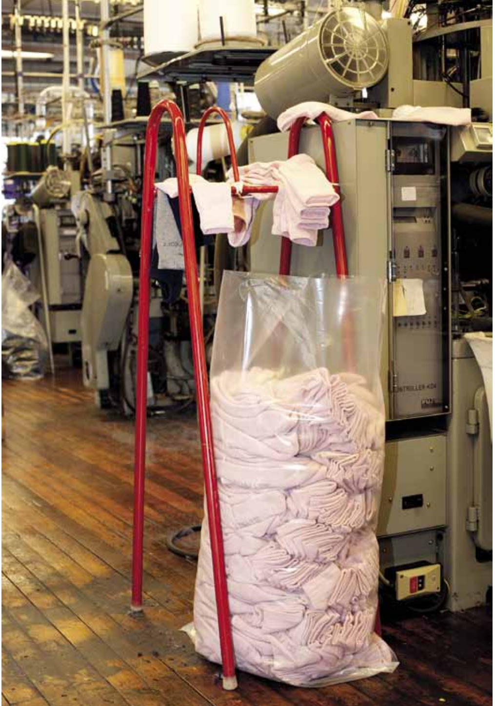
Ferdig strikkede sokker. Fra Safa Samnanger våren 2013.