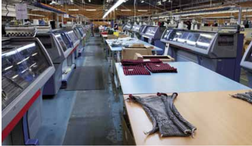
Fra strikkesealen på Dale of Norway.

linjen nå, at nå begynner vi å tjene penger, og det er jo hyggelig, men det er jo samtidig leit når det må gå ut over norske arbeidsplasser». 27 For å kunne produsere i Norge må du, i følge Bruvik produsere et nisjeprodukt slik Oleana, Rauma Garn og Røros Tweed gjør.