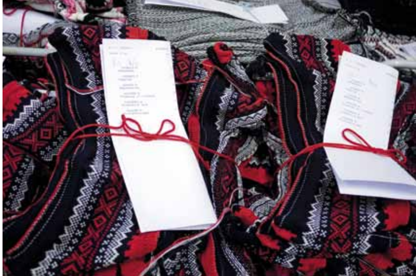
Ferdig strikket og klar for å sendes til Polen.