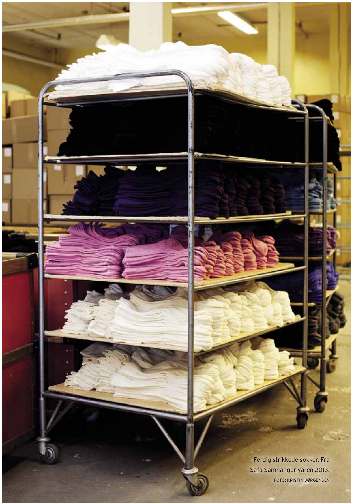
Ferdig strikkede sokker. Fra Safa Samnanger våren 2013.