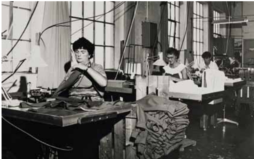
Syersker som arbeide på Salhus Tricotagefabrik. Frå omkring 1950.

på ein tekstilfabrikk, var (og er) å vere tilsett som mekanikar kor nokon også hadde fagbrev som strikkarar. Strikkemaskinane var til dels svært kompliserte og arbeidaren måtte ha stor teknisk kunnskap. Strikkarane var ikkje i direkte kontakt med sjølve tekstilet, men dei mata maskinane med tråd på spoler og maskinane gjorde tråden om til strikka metervare som deretter gjekk vidare til andre arbeidsoperasjonar i fabrikk. Mange strikkarar kunne utføre vedlikehald av strikkemaskinane, som til dømes å skifte nåler, olje og reinse maskinane og delane, men oftast var det eigne reparatørar som reparerte strikkemaskinane, og desse var òg menn. Ein annan informant, ein mannleg strikkar, har si forklaring på kvifor kvinnene ikkje kunne jobba som strikkarar: «Nei, her var meir skit, det var ikkje så reinsligt, det er grovare veit du, og mykje smøring og greier med olje. Så det var ikkje så fint arbeid.» 35