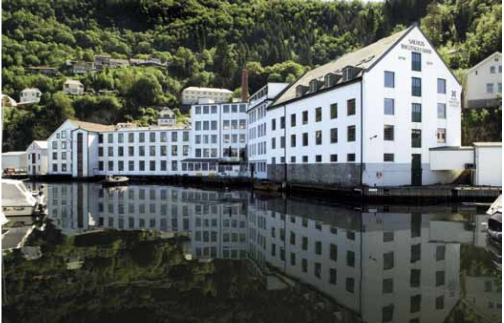
Norsk Trikotasjemuseum sett frå sjøen.

tradisjonelt hadde sine arbeidsplassar for å få fram kjønnsdelinga i arbeidsprosessen på fabrikkene. Framstillinga mi er forenkla og kan ikkje reknast som uttømmende for dei 130 åra det var produksjon ved fabrikkene. Hovudavdelingane var; vaskeri og råvarebehandling, vaskeri og farger, karder, spinneri, spoleloft, strikkeloft, klippeloft, saumavdeling, syloft og samanlegginga. Ved sidan av dette var det også andre avdelingar både innanfor administrasjon og tekniske avdelingar. Dette går eg ikkje nærare inn på her, men eg skal sjå kort på dei seinare i artikkelen. Tekstilindustrien var ein arbeidsintensiv industri, 8 og kravde mange arbeidshender for å få utført alle ledda i den mekaniske og manuelle produksjonslinja frå råvare til eit ferdig produkt. 9 Ulla eller bomulla skulle reinsast/vaskast, sorterast og blandast til beste kvalitet, før den kunne sendast til karderiet for karding. Dette var fysisk tungt manuelt arbeid som mennene utførte. Det var mindre fysisk krevjande å ha den prestisjefulle stillinga som ullklassifisør (med formelle kvalifikasjonar). Kardeprosessen gjekk føre seg på store kardeverk som stod tett i tett med opne (etter kvart endra dette seg) reimsystem som innebar fare for skadar. Det var òg mykje støv og støy her. Dette var òg rekna som mannfolkarbeid. Forgarnet, resultatet av kardinga, blei vidare spunne til tråd i spinneriet. Fram til den siste perioden med produksjon var det oftast mennene som arbeidde ved spinnemaskinane, men frå omkring 1960-