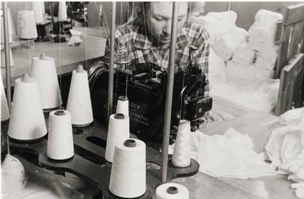
Syersker som arbeidde på Salhus Tricotagefabrik. Frå omkring 1950.

Førestillingane om kvinnene og rettane som dei hadde generelt i samfunnet på denne tida, kjem tydeleg til syne i arbeidsdelinga og i