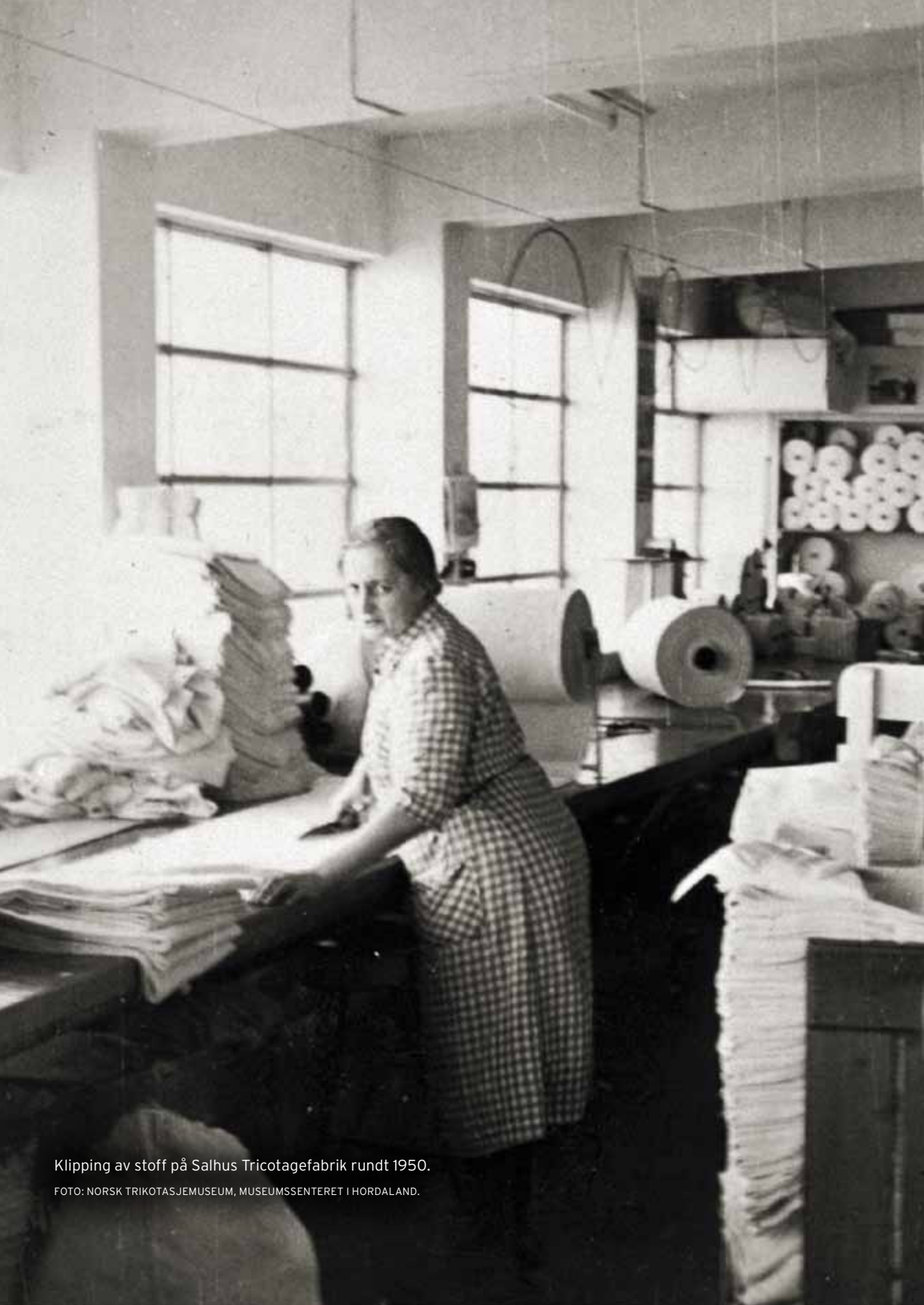
Klipping av stoff på Salhus Tricotagefabrik rundt 1950.