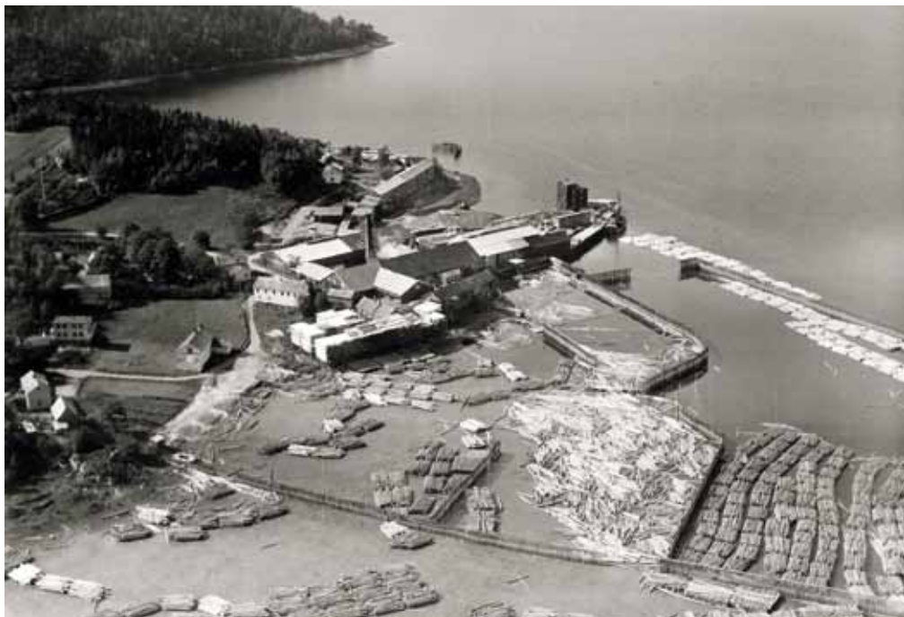
Spillumbruket (tidligere Spillum Dampsag & Høvleri). Flyfoto 1954.

fjerde første i landet. Ferdighusene ble laget etter standard typetegninger, eller på spesialbestillinger fra den enkelte kunde. 8