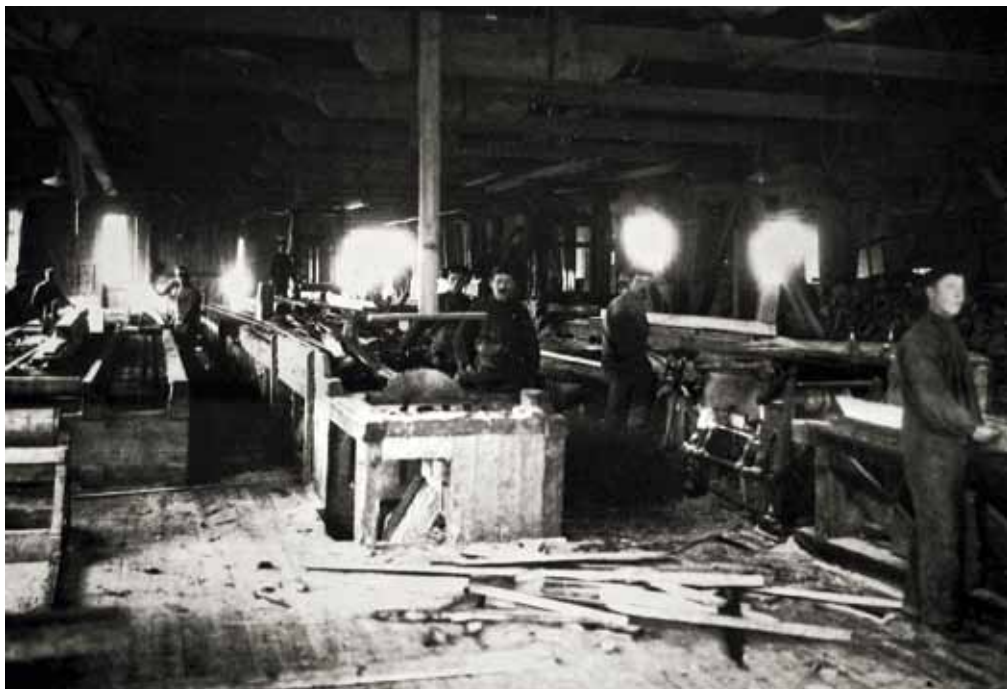
Inne i Spillum Dampsag & Høvleri ca. 1900.

sanket bær og jaktet for salg for å supplere husholdets inntomme og spe på eget kosthold. Enda flere kombinerte sagnarbeidet med skogsarbeid. Det var gunstig, idet virksomheten var størst ved sagbruket i sommerhalvåret, mens skogsarbeidet forgikk om vinteren. Ved sagbruket på Spillum var det i praksis ingen aktivitet fra inngangen av desember og fram til siste halvdel av januar måned.