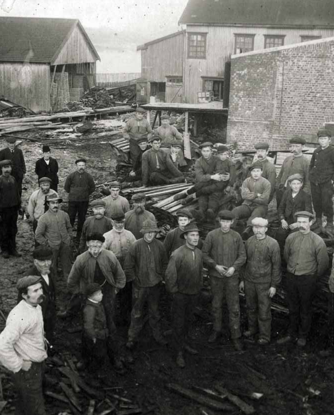
Arbeidere ved Spillum Dampsag & Høvleri ca. 1910-1915.