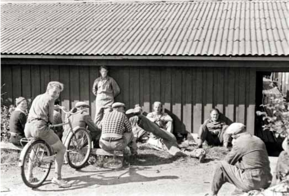
Matpause i solveggen på Spillumbruket i 1954.

sibiliteten på selve arbeidsplassen ble likevel ikke mye større selv om man hadde mer fritid. For øvrig eksisterte en paternalisme i mer «moderne» form ennå etter 1945. Den var ikke like autoritær som før, men noen av de samme elementene var der. 43 Et eksempel på Spillum var dusjanlegg og badstue som ble bygd for arbeiderne og deres familier. Utenforliggende forhold var uansett avgjørende. Det fikk man smertelig erfare da strukturrasjonalisering rammet mange aktører i sagbruksnæringen fra rundt 1970. Spillumbruket ble selv et offer for den da det ble kjøpt av Norske Skogindustrier og lagt ned i 1986.