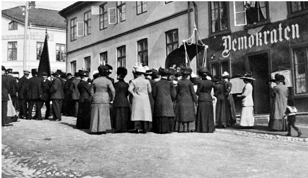
Lokalene til Demokraten lå i Sverres gate med redaksjonen i andre etasje. Her gjøres det klart til 1. mai-tog i 1910.

siktes det til etableringen av et Arbeidernes Pressekontor i 1912, 21 selv om det er tvilsomt om etableringen kan tolkes som et tidlig utslag av sentralisering. 22 Etter andre verdenskrig ble sentraliseringen omtalt i innforståtte termer, slik at det i et tilbakeblikk på perioden før første verdenskrig kunne hete: «Sentralstyret hadde imidlertid ikke samme innflytelse over de enkelte papiraviser som nå». 23 Den øvrige pressen fulgte for øvrig etter arbeiderpressen i grad av partiloyalitet, slik at partipressen som institusjon i Norge først sto i «senit» mellom 1945 og 1972. 24